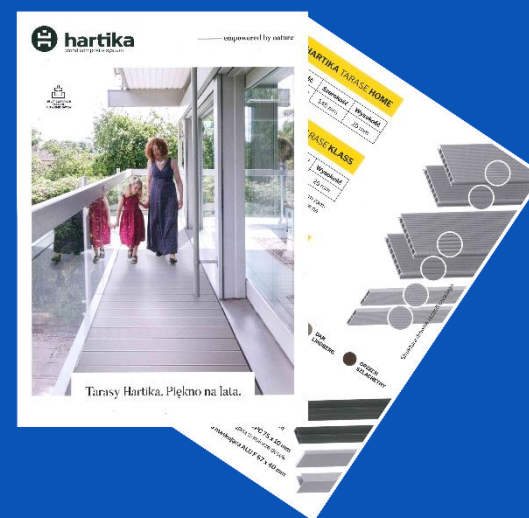
ulotka papier, format A5