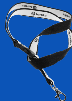
smycz z nadrukiem